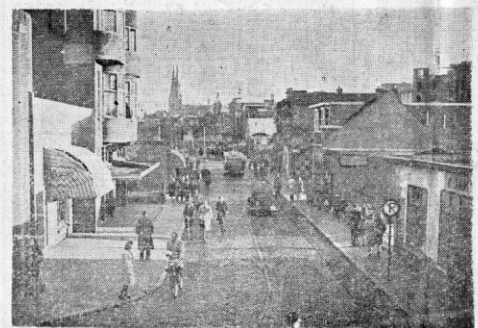
OUDE FELLENOORD. — Een oud geliefd stadsdeel (met overweg) dat heel spoedig gaat verdwijnen